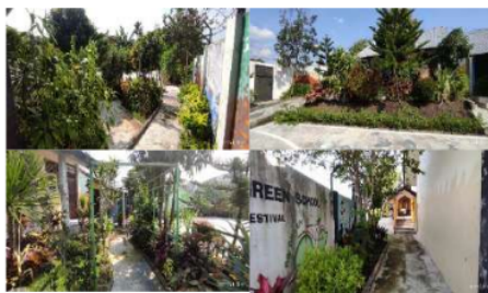
Gambar 3. Eksisting

menarik, seperti akuaponik, tanaman hias, tanaman bunga, hingga pohon. Taman jenis ini ada yang berupa pembatas, sehingga membatasi siswa untuk beraktivitas di dalamnya. Ada baiknya perlu pemilihan untuk jenis tanaman yang sesuai agar siswa bisa beraktivitas di dalamnya. Poin pentingnya keterkaitan dengan pembelajaran outdoor untuk literasi siswa pada ruang gazebo . Sejauh ini gazebo hanya berjumlah satu saja, namun demikian di teras terdapat kursi tunggu. Sirkulasi dibedakan antara teras dan jalan setapak sehingga cukup variatif. Pada dinding luar sebagai pembatas diberikan poster atau grafis yang bersifat edukatif namun pesan tertulis antara dinding yang satu dengan yang lain tidak berhubungan. Berdasarkan diskusi dengan Ibu kepala sekolah, daerah yang paling berpotensi untuk dirancang sebagai taman edukasi adalah ruang terbuka pada bagian belakang ini. Hal ini dikarenakan oleh salah satu pengembangan sekolah untuk menerapkan literasi pada ruang terbuka. Posisinya tidak jauh dari lapangan basket dan perpustakaan, sehingga memberikan ruang baca yang lebih kondusif dan menarik.