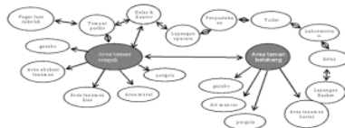
Gambar 5. Diagram bubble untuk hubungan antar ruang

Berdasarkan konsep zonasi ruang di atas, adapun urutan alur zonasinya dimulai dari tamana tengah yang terbagi atas (1) area literasi ( gazebo ), (2) area edukasi, keterlibatan siswa dalam proses pembelajaran, (3) area tanaman hias dan pohon, (4) area pergola, (5) area mural. Taman belakang terdiri atas (1) area literasi ( gazebo /bangku taman), (2) area refreshing