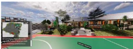
Gambar 6. Hasil rancangan taman pintar di SMPN 26 Malang

terapi (air mancur), (3) area tanaman pembatas, dan (4) area pergola.