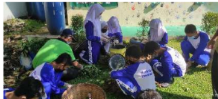
Gambar 2. Kegiatan komposting daun kering dengan EM4 atau bakteri fermentasi

pada setiap antar gedung dan ruang terbuka yang luas dimanfaatkan untuk ruang upacara dan olahraga. Dalam proses pembelajarannya, seringkali diharuskan langsung belajar ke ruang luar. Contoh, masalah sampah, energi dan air. Di dalam permasalahan air, guru IPA dalam kompetensi dasarnya dicantumkan tentang bagaimana cara menjernihkan air, kemudian bidang lainnya ada komposting, pembibitan atau penanaman kembali pohon ada di mata pelajaran biologi atau masuk rumpun IPA juga. Semua bisa diaplikasikan dalam kegiatan pembelajaran, literasi di luar ruang dan tempat istirahat siswa. Sehingga perlu adanya fasilitas yang dapat mawadahi aktivitas pembelajaran tersebut (Greer, Rainville, Knausenberger, & Sandolo, 2019; Lowry, 2011; Retzlaff-Fürst, 2016; Taylor, Wright, & O'Flynn, 2021).