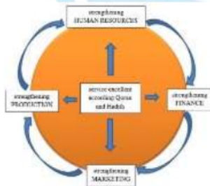
Gambar 1: Model Laporan Daring KPPS

Dengan demikian strategi konsep penelitian ini dinamakan “Strategi Bank Syariah Berbasis Penguatan Manajemen Keuangan, Pemasaran, Produksi Dan Sumber Daya Manusia (SDM)” yang kegiatan operasionalnya berpedoman pada Al-Qur’an dan Hadist secara transparan dan amanah kepada nasabahnya atau yang disingkat dengan KPPS STRATEGY Based On Transparency use a-Qur’an and Hadist Principle . KPPS Strategic digambarkan dalam gambar 1.