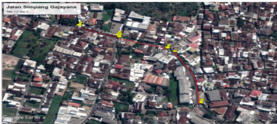
Gambar 2. Lokasi Penelitian