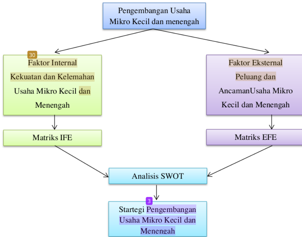
Gambar 6.1. Bagan Kerangka Strategi Pengembangan Usaha Mikro Kecil dan Menengah

Berikut ini adalah bagan kerangka dari sebuah strategi pengembangan bagi Usaha Mikro kecil dan Menengah