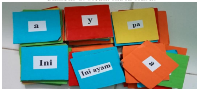
Gambar 1. Media Kartu Huruf

Sedangkan menurut penelitian (Sumantri et al., 2017), media pembelajaran berupa permainan kartu abjad yang diterapkan guru saat pembelajaran bahasa Indonesia berpengaruh terhadap peningkatan kemampuan membaca awal siswa. Oleh karena itu, kartu huruf dapat dirancang sendiri dan digunakan dalam proses pengajaran untuk merangsang vitalitas siswa. Namun huruf abjad yang dimaksud di sini adalah kartu huruf yang dibuat sendiri berbentuk persegi panjang yang terbuat dari karton dan origami, lihat Gambar 1 untuk contoh media gambar.