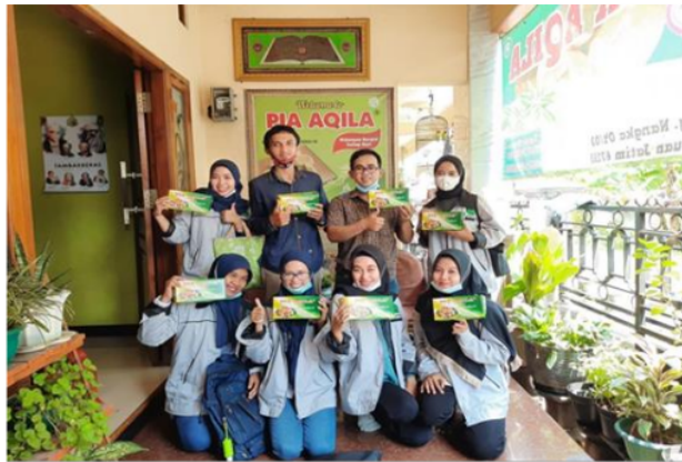
Gambar 3. Produk Pia Aqila dengan kemasan sebagai strategi pemasaran