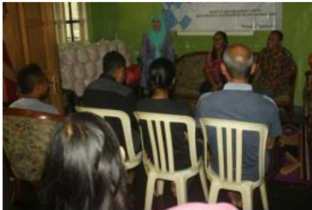
Gambar 2. Pelaksanaan Pelatihan Akuntansi dan Strategi Pemasaran

Selain perbaikan sistem akuntansi UMKM yang sesuai dengan SAK EMKM, pengabdian memberikan materi analisis SWOT guna pengembangan usaha.