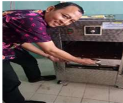
Gambar 3. Mesin Pembuat Telur Asin

Mesin pembuat telur asin yang digunakan untuk produksi telur asin mempermudah mitra karena