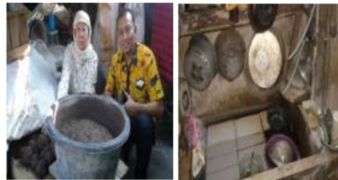
Gambar 1. Pembuatan dan pencucian telur asin secara tradisional

Proses produksi telur asin masih tradisional dengan cara membersihkan telur menggunakan air terlebih dahulu dengan tujuan untuk menghilangkan noda dipermukaan telur. Kemudian keringkan telur baik menggunakan kain kering. Setelah kering maka di amplas agar pori – pori telur terbuka dan adonan untuk mengasinkan telur dapat meresap. Bungkus telur asin dengan menggunakan adonan berupa abu gosok lalu proses pemeraman telur selama beberapa hari. Pada saat pemeraman, mitra menggunakan wadah penyimpanan telur dengan kapasitas kecil dan proses pemeraman telur yang lama yaitu ; 10 hingga 15 hari, sehingga hal ini memerlukan inovasi teknologi produk untuk mempercepat proses pengasinan. Selain wadah yang kecil pada saat pemeraman telur asin, mitra juga membersihkan adonan abu gosok yang menempel pada telur secara tradisional atau digosok secara manual menggunakan sabut stainless. Cara membersihkan adonan abu gosok yang membungkus telur asin secara tradisional memerlukan waktu yang lama bahkan melebihi jadwal yang sudah ditentukan dalam membersihkan adonan abu gosok yang tentunya berdampak pada tidak terpenuhinya kebutuhan pasar.