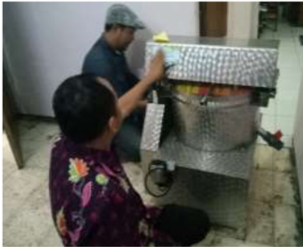
Gambar 4. Alat Pencuci Telur Asin

dapat memproduksi dengan kapasitas yang besar dalam satu kali pembuatan mencapai 100 hingga 200 butir telur, selain kapasitas yang besar waktu yang diperlukan lebih singkat dibandingkan pembuatan secara tradisional yaitu; 3 hari. Mesin pembuat telur asin terbuat dari bahan plat stainless yang berukuran panjang 60 cm, lebar 57 cm dan tinggi 110 cm. Model mesin pembuat telur asin memiliki penyimpanan telur asin berbentuk rak yang terdiri dari 3 rak (gambar 3).