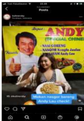
Gambar 4. Foto di tempat kuliner yang menarik di akun @kulinersby

“Saya nggak melulu post soal kuliner, tapi kita juga ngebahas kaya hal-hal selain itu, misalnya resto yang dibuatnya di atas sungai itu bagus kita tonjolkan, juga biasa kita review karena ownernya dan tempatnya yang unik. Kalau missal ownernya asli dari Belanda, itu unik kalau kita beri judul bule jualan cendol,” (Syafira, 9 Januari 2021)