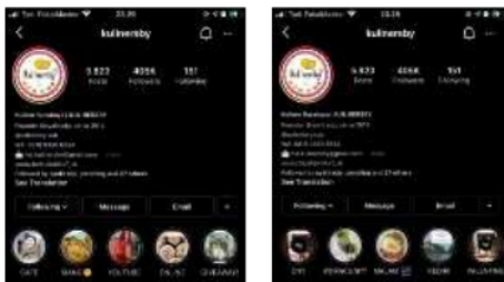
Gambar 7 & 8. Tampilan highlight di akun @kulinersby menunjukkan kreatifitas konten sharing oleh pemilik akun.