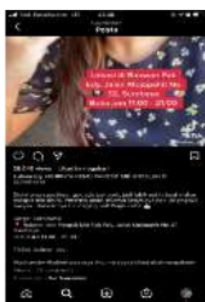
Gambar 2. Caption @kulinersby khas dan menarik untuk dibaca

Karena akun ini sudah berkembang pesat, banyak pemilik resto yang ingin menggunakan jasa @kulinersby untuk endorse . Akun ini menawarkan dua pilihan untuk pembuatan video endorsement , yaitu dengan cara memiliki request secara khusus atau diserahkan langsung ke pihak @kulinersby. Request dari pemilik makanan tidak diperbolehkan bohong atau memanipulasi produk karena akan merusak citra resto dan @kulinersby sendiri. Dalam setiap konten yang dibuat di akun @kulinersby adakah keterkaitannya dengan konten-konten sebelumnya sehingga selain tidak meninggalkan ciri khas konten @kulinersby juga menjaga konsistensi dalam melakukan promosi.