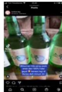
Gambar 6. Keterangan produk babi

Guna memudahkan followers -nya ketika mencari makan di setiap waktu, Syafira membuat highlight di Instagram dengan beragam tajuk, seperti menu sarapan, makan siang, hingga makan malam. Pembuatan konten ini kreatif dan solutif mengingat kebanyakan akun kuliner tidak memperhatikan hal ini. Tajuk lain juga diperhatikan seperti beberapa lokasi kafe yang hits, beberapa lokasi khusus, juga tempat kuliner yang cocok untuk moment tertentu.