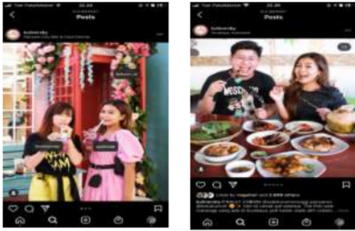
Gambar 9 dan 10. Foto bersama food vlogger lain di akun @kulinersby

followersnya di atas aku, dan kami juga berteman baik” (Syafira, 9 Januari 2021)