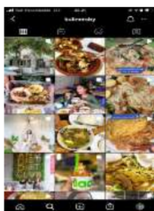
Gambar 1. Postingan @kulinersby menggunakan foto yang menarik

dari A-Z semua di kontrol sama aku, dan aku pasti kasih review sedetail mungkin,” (Syafira, 9 Januari 2021)