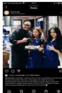
Gambar 3. Salah satu postingan pada event cooking class di akun @kulinersby

“Kalau untuk konten dari dulu semuanya tentang makanan tentang kuliner tapi makin ke sini aku mulai terbuka jadi ga cuma makanan aja kadang ada event, misalnya aku ngereview bazar tapi tetap tidak menghilangkan ciri khasnya misalnya aku ngereview event aku tetep kaitin dengan makanan yang ada di sana” (Syafira, 9 Januari 2021)