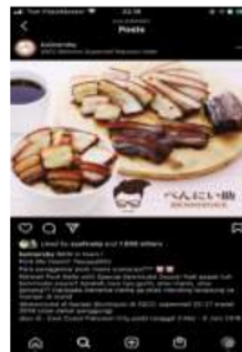
Gambar 5. Label halal di akun @kulinersby

@Kulinersby dapat membuat konten dan berbagai produk yang dipromosikan walaupun tidak semuanya bisa diterima oleh sebagian kelompok masyarakat namun dapat dikemas dalam sebuah konten sehingga ketersinggungan masyarakat tidak terjadi. Akun @Kulinersby mampu membuat dan mengemas produk yang akan dipromosikannya sangat banyak sekali dan tidak menjadi halangan dan hambatan tim untuk menyelesaikannya. Strategi promosi dalam mempromosikan kuliner sehingga konsumen atau masyarakat sangat tertarik dengan kuliner yang tertera atau beranda di media sosial dari akun instagram @kulinersby sehingga masyarakat berminat mencari dan membelinya.