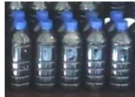
Gbr.4. Asap Cair Grade 3

meningkatkan laju pertumbuhan tumbuhan, dapat mengendalikan gulma ( Herbisida ), anti bakteri ( Pestisida ), anti jamur ( fungisida ) dan dapat untuk mengusir serangga pengganggu ( Insektisida ) pada kegiatan pertanian.