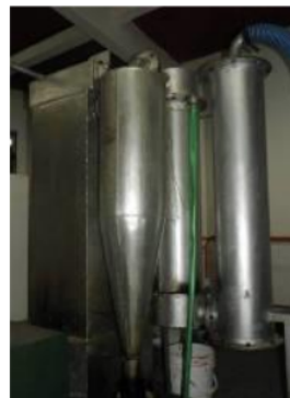
Gambar 1. Unit Pyrolysis di Univ. Tribhuwana Tungadewi, Malang

Metode yang digunakan adalah teknologi proses pyrolysis. Unit Pyrolysis ini terdiri dari reaktor pirolisis yang merupakan alat pendekomposisi senyawa-senyawa organik melalui proses pemanasan pada suhu tinggi yaitu 300-500 \text{ }^\circ\text{C} tanpa berhubungan langsung dengan udara luar. Reaktor pirolisis diisolasi bagian luarnya dengan bata dan tanah untuk mencegah panas yang ada dalam reaktor keluar secara berlebihan, kemudian dilengkapi dengan alat penangkap tar ( Cyclon ) dan seperangkat alat kondensasi, yang bisa dilihat pada Gambar 1 berikut.