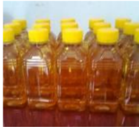
Gbr.2. Asap Cair Grade 1

Asap Cair ( Liquid Smoke ) hasil produksi Pusat Kajian dan Pengembangan TTG dan Energi UNITRI dibedakan ke dalam 3 grade dan masing-masing grade telah disesuaikan dengan kegunaannya antara lain :