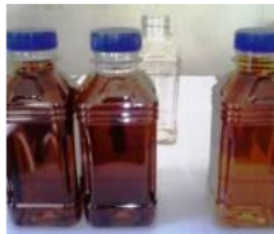
Gbr.3. Asap Cair Grade 2

Grade 1 , Memiliki warna yang bening; rasanya sedikit asam; aromanya netral. Grade 1 ini bagus untuk industri pangan karena dapat menghambat perkembangan bakteri karena sifat antimikrobia dan antioksidannya. Peruntukan: pengawet makanan, daging, ikan dan bumbu.