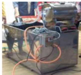
Gambar 1. Mesin vacum penggoreng kripik buah salak

menggunakan peralatan sederhana karena dari segi mekanisasi peralatan masih dioperasikan secara manual, pada tahapan yang dilakukan dari beberapa proses produksi. Hal ini menyebabkan jumlah target produksi yang dihasilkan perhari tidak menentu, karena jumlah bahan baku yang tidak mencukupi dalam target produksi. Selain itu, dilihat dari tahapan proses produksinya, cara pembuatan keripik buah salak pondoh tersebut relatif mudah dan tidak memerlukan banyak keahlian khusus. Akan tetapi, melalui kegiatan pengabdian ini, kedua kelompok wanita tani tersebut telah mendapatkan alat yang diberikan tim kepada kelompok wanita tani Srikandi dan Karya Bhakti berupa mesin pengolah keripik buah salak yang modern, sehingga dapat menghasilkan keripik buah salak pondoh yang diminati konsumen dari segi aroma, rasa dan warna. Begitu pula halnya dengan teknik pengemasan dan design labelling telah dilakukan pelatihan dan cara membuat kemasan yang sesuai dengan menggunakan pengemas Aluminium Foil dan design label "NaCia". Berikut ini penyerahan alat, pelatihan, pendidikan, dan pendampingan yang dilakukan tim kepada kelompok Wanita Tani Srikandi dan Karya Bhakti :