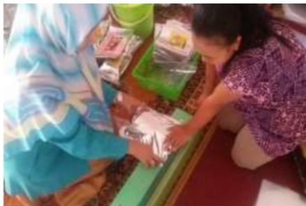
Gambar 4. Pendampingan dalam teknik pengemasan menggunakan aluminium foil