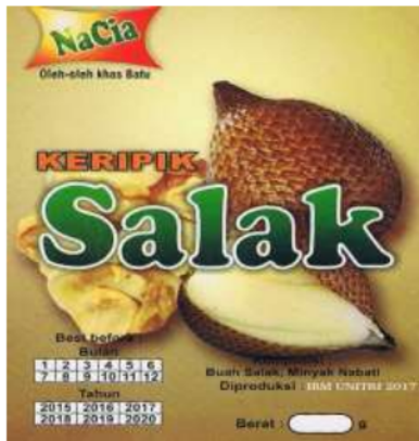
Gambar 2. Design Labelling kemasan keripik buah salak