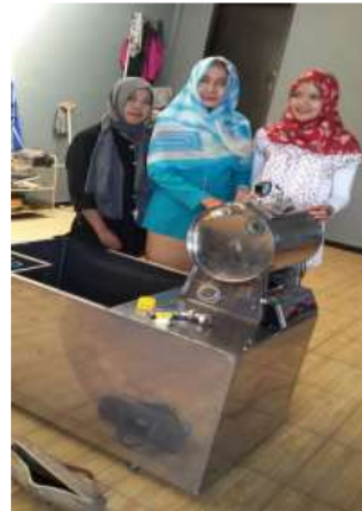
Gambar 5. Serah terima alat dari tim kepada kelompok industri rumah tangga keripik buah salak