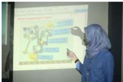
Gambar 3. Pendidikan oleh tim kepada kedua kelompok industri rumah tangga