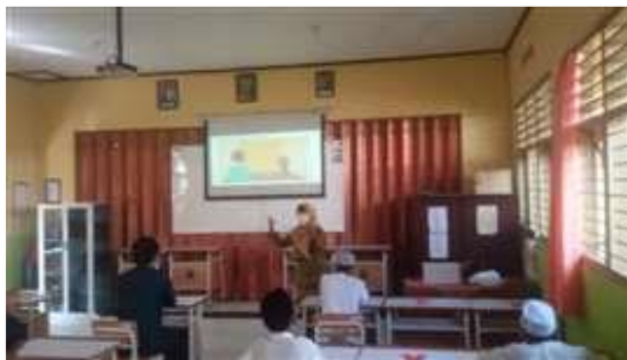
Gambar 2. Pemaparan Materi terkait Covid-19

Penerapan protokol kesehatan 3M sangat penting. Menurut Anugerah et al. (2019), masyarakat yang kurang peduli terhadap cara pencegahan covid-19 sangat rentan terkena penyakit ini karena virus korona berada di mana saja dan dapat menulari siapapun.