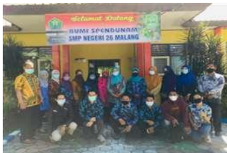
Gambar 6. Tim Abdimas Universitas Tribhuwana Tungadewi Malang