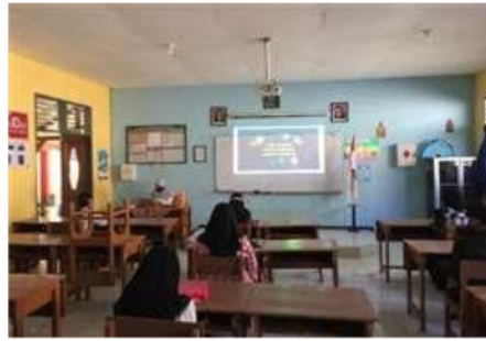
Gambar 3. Pemaparan Materi Menggunakan Video untuk Menarik Perhatian Siswa SMPN 26 Malang