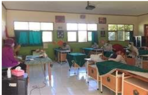
Gambar 1. Persiapan Sebelum Sosialisasi ke Kelas-Kelas di SMP Negeri 26 Malang