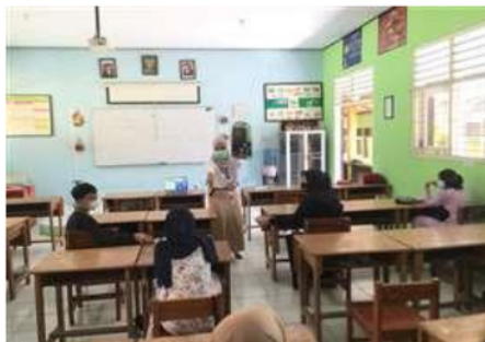
Gambar 5. Evaluasi dengan Mengajukan Pertanyaan kepada Salah Satu Siswa SMPN 26 Malang

Tanggapan pihak mitra yaitu SMP Negeri 26 Malang terhadap program sosialisasi covid-19 disambut baik dan mengucapkan terima kasih kepada Universitas Tribhuwana Tungadewi karena telah memberikan edukasi kepada siswa. Kegiatan ini dapat menambah wawasan siswa, selain itu siswa dapat mengaplikasikan dan mengamalkan protokol kesehatan sehingga dapat membantu mengurangi penularan covid-19.