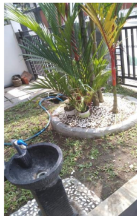
Gambar 2. Hasil Desain Outdoor Kelas