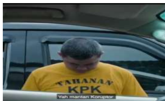
Gambar 7. Caleg yang awalnya berpakaian rapi ternyata seorang tahanan KPK

Video berjudul ‘Tampang Caleg’ pada #unboxingcaleg Caleg yang sudah pernah didakwa melakukan korupsi tetapi masih punya kepercayaan diri menjadi Caleg di pemilihan selanjutnya. Caleg ‘koruptor’ yang masih mencalonkan diri lagi sebagai Caleg merupakan satu penanda adanya petanda : ‘ketidakpedulian’ terhadap integritas. Jika dirinya tersangkut korupsi dan masih mau menjadi Caleg maka dia tidak memberikan pendidikan politik yang baik bagi masyarakat. Sehingga sangat dikhawatirkan akan terjadi kasus yang sama ketika dia masih menjadi anggota dewan.