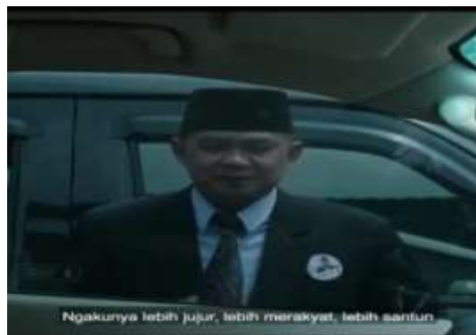
Gambar 6. Caleg yang berpakaian rapi berdiri di luar jendela sebuah mobil

sudah mencapai angka yang fantastis, tetapi ada keyakinan bahwa kasus korupsi di Indonesia masih banyak yang tidak terungkap. Sebabnya, pada tahun 2018 KPK mendapatkan 1.063 laporan lewat telepon, 1.813 email, 436 kasus dilaporkan secara langsung, dan 64 melalui pos (KPK, 2018).