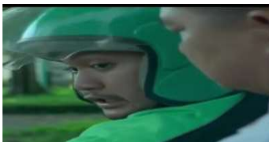
Gambar 9. Driver Ojek online berbalik memarahi Caleg karena minta cepat

Signifier dalam video kali ini adalah soal kecepatan dan pekerjaan. Zaman ini menuntut adanya kecepatan yang menjadi ciri dari kemajuan (Piliang, 2011:83). Kecepatan saat ini salah satunya ditandai dengan hadirnya ojek online yang saat ini pasar Indonesia dikuasai oleh Go-Jek dan Grab. Caleg dalam video tersebut menggunakan jasa Grab untuk berpindah dari tempatnya menunggu ke lokasi kampanye. Agendanya, dia harus cepat sampai agar bisa berbicara di depan massa untuk memilihnya.