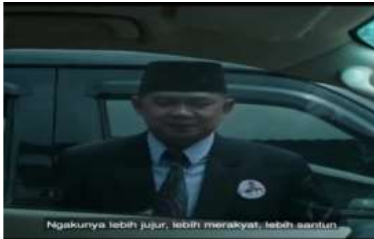
Gambar 2. Caleg ketika dilihat dari jendela di dalam sebuah mobil berpakaian jas, berdasi, dan berkopiah.

tiga judul video dari tujuh video yang telah dianalisis. Tiga video ini berjudul : ‘Tampang Caleg’, ‘Jangan Gampang Percaya Janji-janji Caleg’ dan ‘Azab Caleg Suka Umbar Janji’.