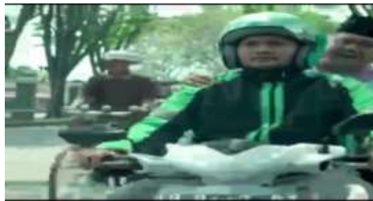
Gambar 8. Caleg dibonceng oleh ojek online dan didahului oleh sepeda ontel

Driver: Cepat-cepat, emang bapak bikin undang-undang bisa cepat?