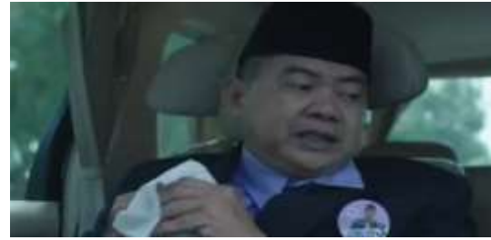
Gambar 10. Caleg bertanya agenda kampanye kepada asisten

Pencitraan sebenarnya tidak bisa dilakukan hanya ketika kampanye. Pencitraan membutuhkan waktu panjang yang dapat mengaktifkan nilai-nilai partai yang dapat memberikan solusi bagi masalah di masyarakat (Wasesa, 2011:4). Tetapi kenyataan di lapangan pencitraan selalu dilakukan oleh politisi pada saat kampanye lima tahunan ketika mencalonkan diri pada Pileg, Pilkada, dan Pilpres.