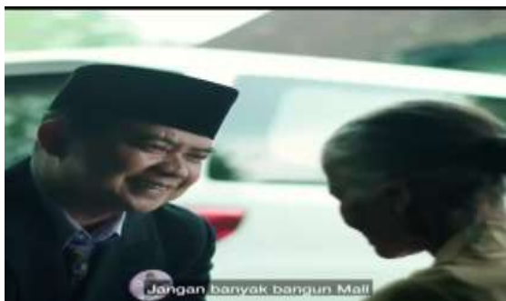
Gambar 5. Dialog Caleg pembohong dengan seorang konstituen

mendatangi sebuah pasar tradisional dan berdialog dengan seorang perempuan tua. Caleg berjanji akan menepati janjinya kepada perempuan tersebut. Dialog: Nenek: Bapak kalo terpilih jangan lupa dengan kami yang kecil-kecil ini, jangan banyak bangun mall, biar kami tetap bisa dagang. Caleg: Pasti mbah saya tidak akan lupa!.