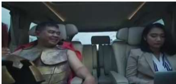
Gambar 12. Caleg berubah menjadi gladiator untuk menarik dukungan

sosok panglima perang zaman Yunani sebagaimana film 300 .