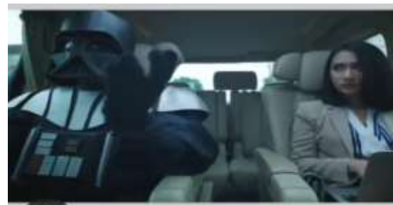
Gambar 11. Caleg berubah menjadi dark vader menarik dukungan

Video yang dibuat TemanRakyat.Id berjudul “Kelakuan Caleg di Negara Berflowler” ini ingin menunjukkan bahwa Caleg hanya bisa melakukan pencitraan tanpa bisa mewujudkan apa yang dicitrakan oleh dirinya. Seorang pemimpin, sebagaimana Caleg, harus menciptakan pencitraan terhadap pribadinya agar mendapat dukungan dari masyarakat (Bungin, 2018:118). Tetapi pencitraan yang dimaksud harus menunjukkan nilai-nilai diri dan partai sehingga bisa dijadikan panutan oleh warga. Bukannya kebohongan dan manipulasi hanya untuk kepentingan sesaat.