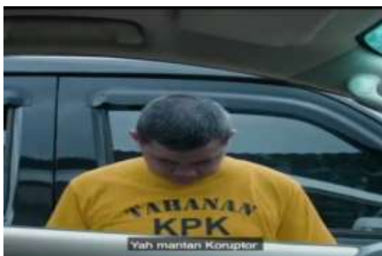
Gambar 3. Ketika kaca jendela dibuka ternyata yang muncul adalah lelaki yang

Gambar tersebut merupakan adegan video berjudul “Tampang Caleg” yang berdurasi 20 detik. Gambar pada scene 1 menunjukkan seorang calon legislatif tersenyum sambil berkaca di samping mobil. Calon legislatif tersebut menggunakan jas dan dasi yang menyimbolkan kaum kaya, pebisnis dan berkelas, lalu peci yang memberi symbol ke-Indonesia-an yang digagas oleh Soekarno (Nordholt, 2005:102) dan pin di dada kiri menunjukkan identitas dirinya sebagai Calon Anggota Legislatif RI.