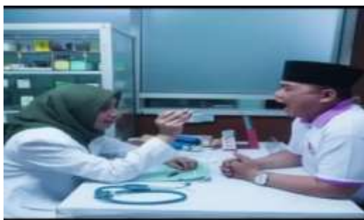
Gambar 4. Seorang Caleg ketika sakit tenggorokan dan didiagnosa umbar janji Pemilu

Dalam video versi lain berjudul “Jangan Gampang Percaya Janji-janji Caleg” juga terungkap tanda-tanda kebohongan. Sebagaimana judulnya sebagai penanda paling awal, video kali ini ingin menunjukkan bahwa Caleg dianggap seorang pembohong sehingga dilarang untuk mempercayai apapun yang dikatakan Caleg. Video pendek ini memiliki durasi 31 detik dengan satu scene saja. Meski hanya 31 detik, tetapi dikemas dengan padat sehingga menampilkan penandaan yang kompleks. Berikut adalah potongan gambar dari video beserta dialognya, Pasien: Tenggorokan saya kenapa Dok? Dokter : Tenggorokan bapak tidak apa-apa. Hanya saja tersumbat janji pemilu bapak 5 tahun yang lalu.