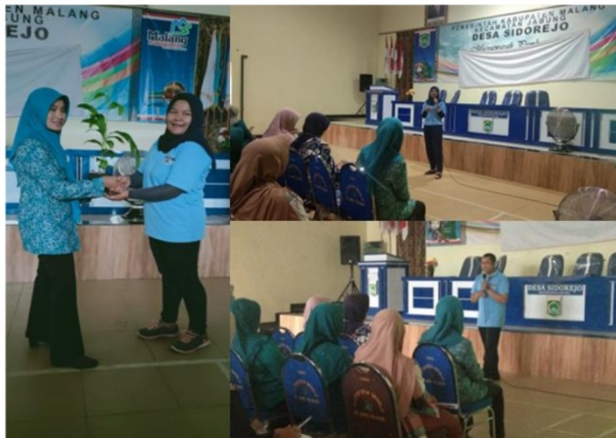
Gambar 3. Penyerahan simbolis tanaman toga dan proses sosialisasi kepada ibu-ibu pemberdayaan kesejahteraan keluarga (PKK)

Kegiatan dari hasil evaluasi kunjungan ke perwakilan dua rumah didapatkan hasil bahwa kebanyakan warga hanya menanam tanaman toga secara tidak layak yang artinya masih hanya asal menanam saja. Tidak ada implementasi kegiatan budidaya yang selayaknya budidaya tanaman toga sehingga hasil yang dihasilkan dari tanaman toga tersebut banyak yang berpenyakit dan busuk. Diharapkan dengan kegiatan penyuluhan tentang pemanfaatan dan keterampilan dalam menanam tanaman obat keluarga (TOGA) efektif dalam meningkatkan pengetahuan masyarakat untuk menanam dan memanfaatkan TOGA untuk kesehatan dan kehidupan sehari-hari. Penanaman TOGA dapat dilakukan di lahan sempit dan dapat dilakukan di media tanam lain seperti polybag . Hasil penanaman dapat dipanen dan diolah secara sederhana oleh individu, pengolahan TOGA cenderung mudah dan gampang seperti digerus, direbus, ditumbuk, diseduh dan sebagainya.