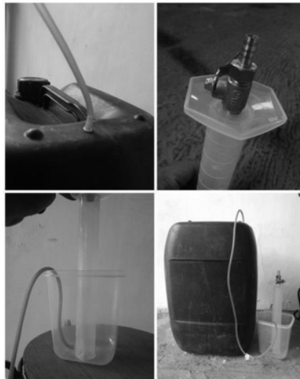
Gambar 4. Fermentor kapasitas 20 liter dengan perangkat pengukur volume dan uji nyala.