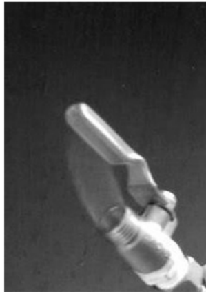
Gambar 2. Uji Nyala Produksi Biogas dari Blotong PG Kreet (Penelitian Pendahuluan)