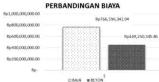
Gambar 2. Diagram perbandingan biaya

Data pada diagram perbandingan biaya ini didapat dari hasil perhitungan RAB struktur baja eksisting dan struktur beton bertulang sebagai pembanding struktur baja.