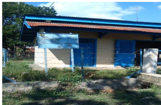
Gambar 1. Sumur bor

Lahan pertanian merupakan suatu media tanam para petani di dalam menggarap, mengolah lahan pertanian, perkebunan dan kehutanan. Oleh karena itu Desa Tebbul Timur yang memiliki 81% dataran-berombak dan 19% tanah berombak-berbukit sangatlah cocok di dalam pengelolaan dan pengembangan pertanian pada umumnya serta pengembangan di sektor perkebunan pada khususnya. Pada tahun 2012 penggunaan lahan di Desa Tebbul Timur terdiri dari tanah kering dan pekarangan dengan luas 189,3 ha, tanah keras seluas 88,0 ha, tanah berpasir atau tanah tandus seluas 5,2 ha, serta lahan yang menggunakan irigasi ½ tehnik seluas 5,0 ha, irigasi sederhana seluas 42,0 ha, dan fasilitas umum seluas 1,09 ha, oleh karena itu peluang di dalam penggunaan dan pengolahan lahan pertanian dan perkebunan sangatlah besar.